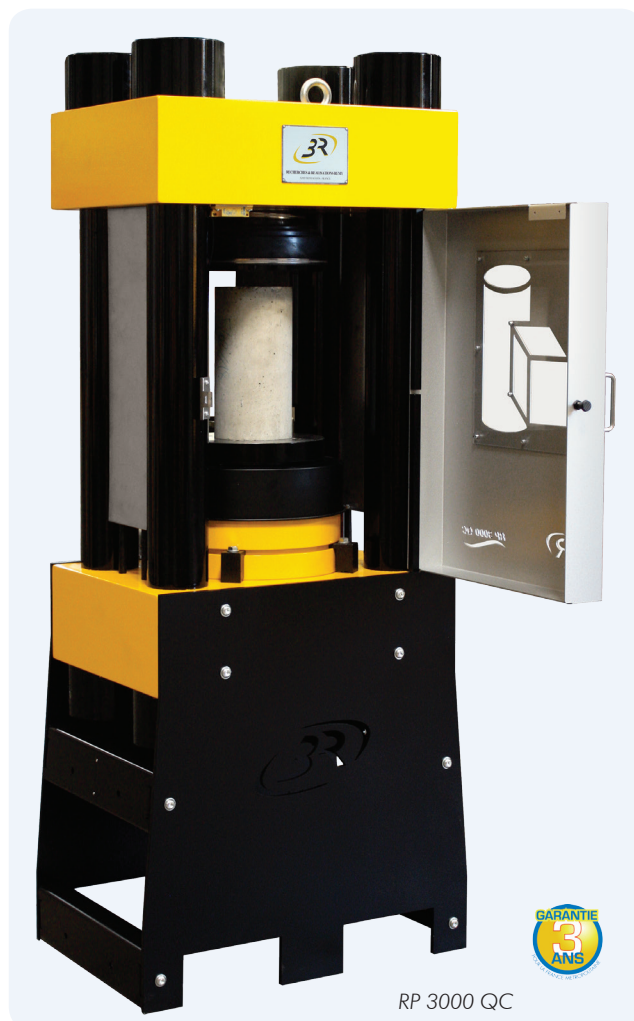
RP 3000 QC