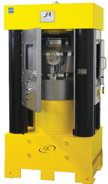
RP 5000 QC